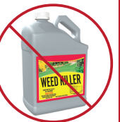
ՔԻՄԻԱԿԱՆ ԵՎ ԴՅՈՒՐԱՎԱՌ ՆՅՈՒԹԵՐ