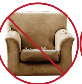
ՉԱՓԱԶԱՆՑ ՄԵԾ ԻՐԵՐ