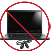
ՀԱՄԱԿԱՐԳԻՉՆԵՐ ԵՎ ԷԼԵԿՏՐՈՆԱՅԻՆ ԳՈՐԾԻՔՆԵՐ