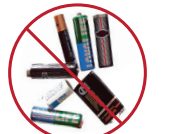
ԷԼԵՄԵՆՏԵՐ ԵՎ ԷԼԵԿՏՐՈՆԱՅԻՆ ԽՐԱՎԱԹԵՐ